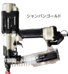
シャンパンゴールド