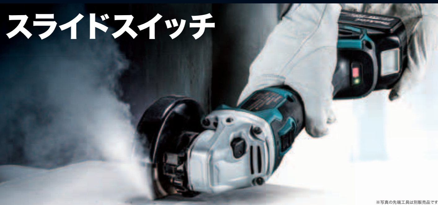
※写真の先端工具は別販売品です。