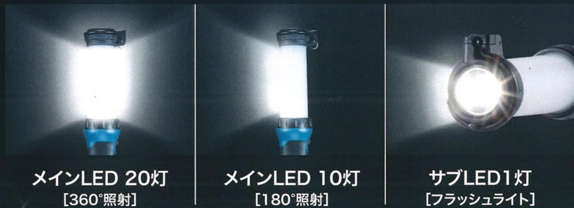
メインLED 20灯 [360°照射]