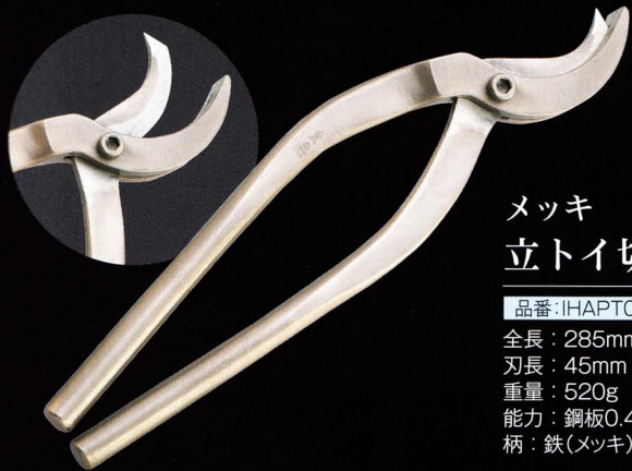
メッキ 立トイ切ハサミ