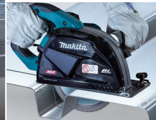
デッキプレートの切断に