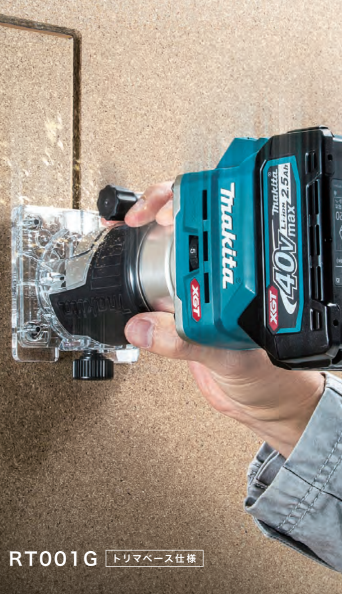
RT001G トリマベース仕様

作業スピード (メラビ溝付け/φ6mmビット、深さ6mm) 約 35% アップ (当社18V機比)