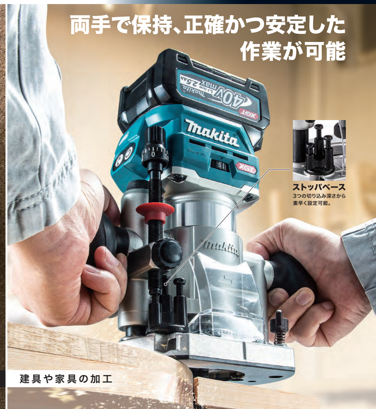
建具や家具の加工