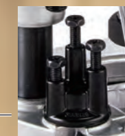
ストップベース 3つの切り込み深さから 素早く設定可能。