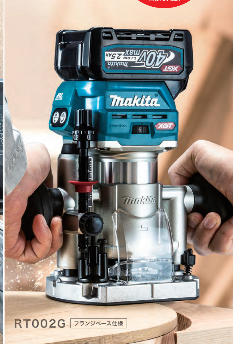
RT002G ブランチベース仕様